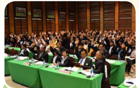
ผู้แทนสมาชิกอนุมัติแผนงาน และงบประมาณประจำปี 2562