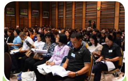
ผู้แทนสมาชิกจากทุกจังหวัดทั่วประเทศ เข้าร่วมประชุม