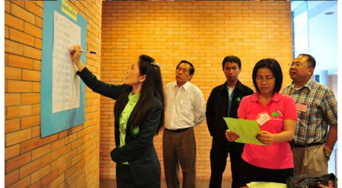
บรรยากาศการเลือกตั้งเป็นไปด้วยความคึกคัก