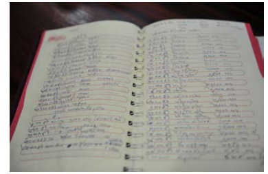
บัญชีรายจ่ายในการส่งลูกชายเรียน มหาวิทยาลัยเกษตรศาสตร์ เพียงต้องการให้ลูกทราบ ว่า เมื่อเรียนจบ พ่อแม่ส่งเงินไปเท่าไร ลูกจะได้รู้จักประหยัดและอดออม

ไม่ว่าจะเป็นการใช้ชีวิตอย่างประหยัดอดออม จัดทำบัญชี รายรับ – รายจ่ายในการทำไร่ และ ทำบัญชีรายจ่ายของบุตรชายที่เรียนอยู่ และสอนให้ลูก ๆ รู้จักการออมโดยการฝากเงินออมทรัพย์ในรูปแบบต่างๆ