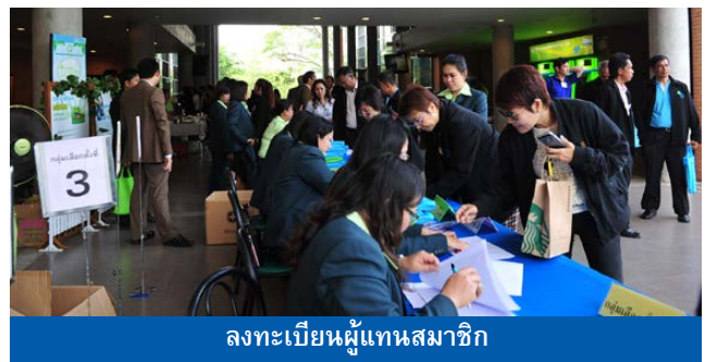
ลงทะเบียนผู้แทนสมาชิก

จากผลการเลือกตั้งกรรมการใหม่ทั้ง 7 คน ดังกล่าว เมื่อรวมกับกรรมการเดิมที่ยังไม่ครบวาระอีก 8 คน รวมเป็น คณะกรรมการดำเนินการ 15 คน ดังนี้