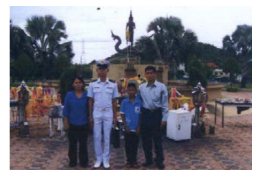
มหาวิทยาลัยเกษตรศาสตร์วิทยาเขตศรีราชา