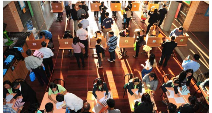
บรรยากาศการเลือกตั้งเป็นไปด้วยความคึกคัก