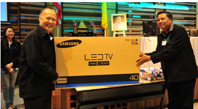
ผู้โชคดีได้รับรางวัลจากการจับฉลาก สนับสนุนของรางวัลโดย บริษัททรูไลฟ์ โบรมเกอร์