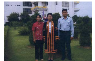
มหาวิทยาลัยราชภัฏพิบูลสงครามพิษณุโลก