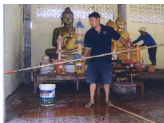
ทำเสร็จทาสี