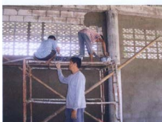
ว่างจากงานก็ช่วยพัฒนาปรับปรุงบำรุงศาสนา

การทำความดี คือ ก้าวแรกของชีวิต เพราะว่าความดีเท่านั้น เป็นสิ่งที่เพิ่มคุณค่าให้แก่ชีวิต ทำชีวิตให้มีมีความสุขมากขึ้น หากปราศจากการทำความดีแล้วชีวิต...ที่แสนสั้นในโลกใบนี้ ก็ยิ่งจะหมดค่าลงไปทุกที เพราะฉะนั้นเราจึงควรรีบทำความดีทุกวัน เพื่อแข่งกับเวลาที่มันกลืนเอาชีวิตของเราไปทุกขณะจิต ความสุขจากการทำดี เริ่มต้นได้ด้วยมือคุณ