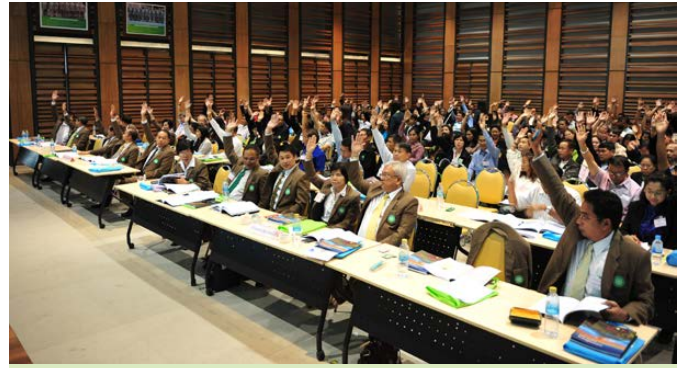
ผู้แทนสมาชิกอนุมัติแผนงานและงบประมาณรายจ่ายประจำปี 2557