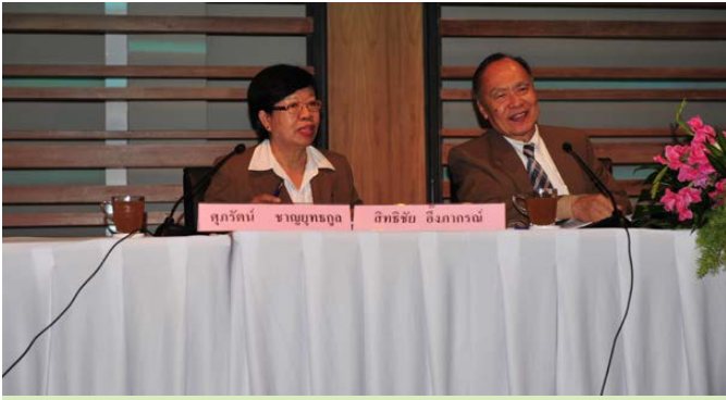
ประธานกรรมการดำเนินการ และ เลขานุการ ดำเนินการประชุม