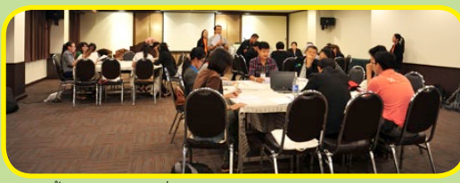
สัมมนาทั้ง 3 กลุ่ม แลกเปลี่ยนทัศนคติ การเข้าถึงข้อมูลข่าวสารของสหกรณ์ และมุมมองการพัฒนาสหกรณ์