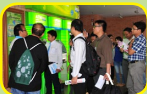
ผู้เข้าร่วมอบรมได้ศึกษาดูงานภาคีสหกรณ์บางเขน ได้แก่ สอ.มหาวิทยาลัยเกษตรศาสตร์ จก., สอ.กรมวิชาการเกษตร จก., สอ.กรมส่งเสริมการเกษตร จก. และ สอ.ปม.