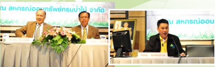
ประธานกรรมการดำเนินการ เลขานุการและผู้จัดการ ดำเนินการประชุม