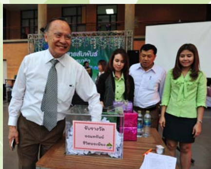
จับรางวัลลอสมทรัพย์ชีวิตพอเพียง