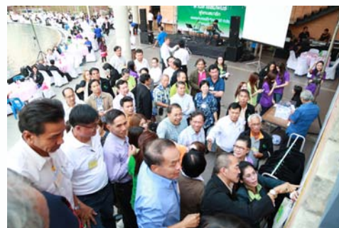
บรรยากาศการเลือกตั้งเป็นไปด้วยความคึกคัก