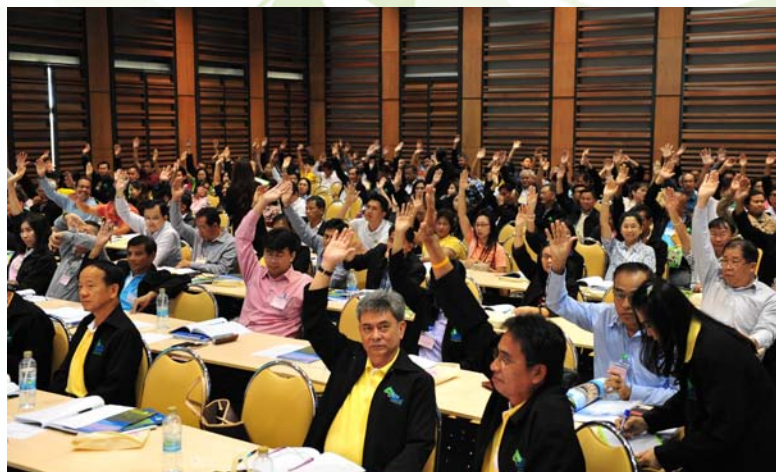
ผู้แทนสมาชิกอนุมัติแผนงานและงบประมาณรายจ่ายประจำปี 2558