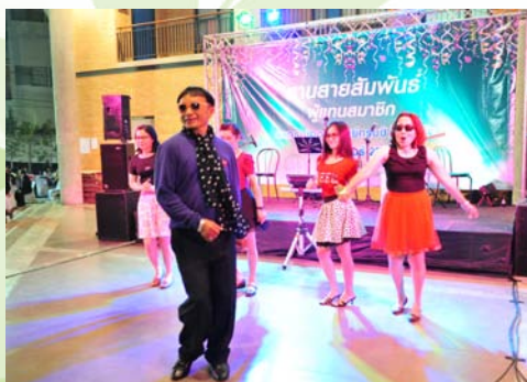
งานเลี้ยงสานสัมพันธ์ผู้แทนสมาชิก