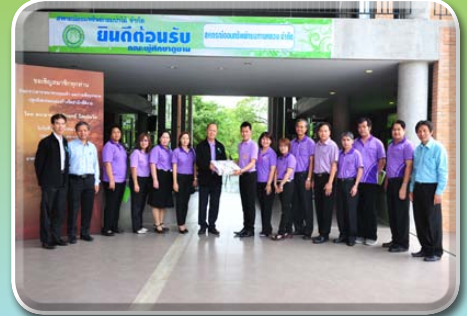
สหกรณ์ออมทรัพย์กรมทางหลวง จำกัด ศึกษาดูงาน วันที่ 20 พฤษภาคม 2558