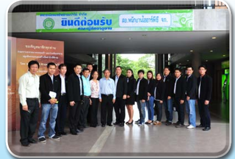
สหกรณ์ออมทรัพย์พนักงานไออาร์พีซี จำกัด ศึกษาดูงาน วันที่ 28 พฤษภาคม 2558