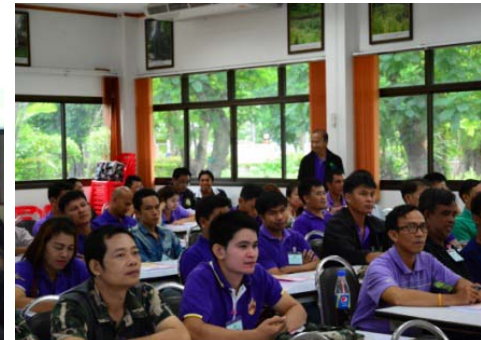
สมาชิกสหภาพ เข้าร่วมฟังการบรรยายอย่างตั้งใจ