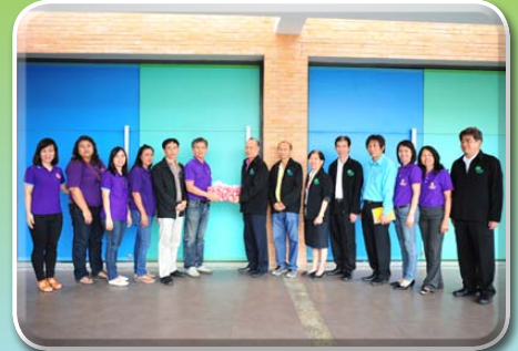
สหกรณ์ฝ่ายทำไม้ภาคเหนือ จำกัด ศึกษาดูงาน วันที่ 5 มิถุนายน 2558