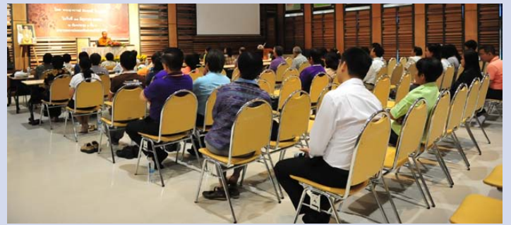
สมาชิกเข้าร่วมฟังธรรมอย่างตั้งใจ