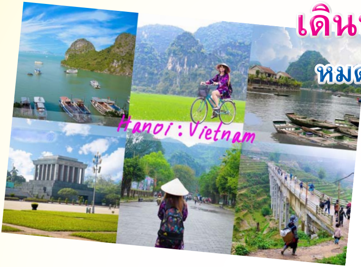
Hanoi : Vietnam

เดินทาง 10-13 ตุลาคม 2558 หมดเขตรับสมัคร วันพุธที่ 5 ส.ค. 58