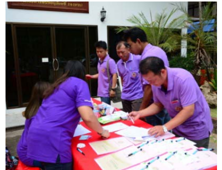
เจ้าหน้าที่ สอ.ปม. บริการสมาชิกสหภาพถึงที่

การให้การศึกษาและการฝึกอบรม เพื่อให้สมาชิกได้มีความรู้ ความเข้าใจในหลักการ อุดมการณ์ และวิธีการสหกรณ์ จึงมีความจำเป็นอย่างต่อเนื่องต่อการพัฒนาสหกรณ์ให้มีความเจริญก้าวหน้า