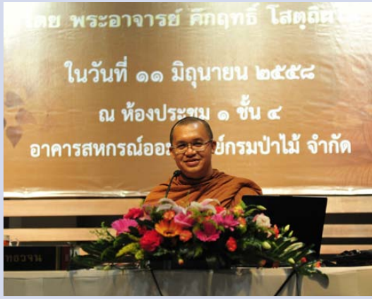
พระคุณเจ้า พระภิกษุ พงศ์สวัสดิ์ ทีปธมฺโม บรรยายธรรม พุทธวชน

การฟังธรรมเปรียบเสมือนการสร้างถ้าให้แก่จิตใจ ถ้าท่านสร้างถ้าไว้ในจิตใจด้วยความสงบ ฟังไปก็เกิดความรู้ ความดี มีพลังและปัญญา ทำให้จิตใจแจ่มใส เบิกบาน