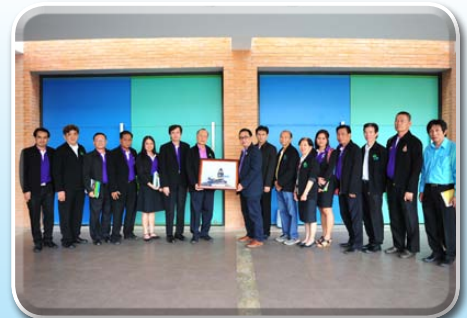
สหกรณ์ออมทรัพย์สาธารณสุขสงขลา จำกัด ศึกษาดูงาน วันที่ 5 มิถุนายน 2558