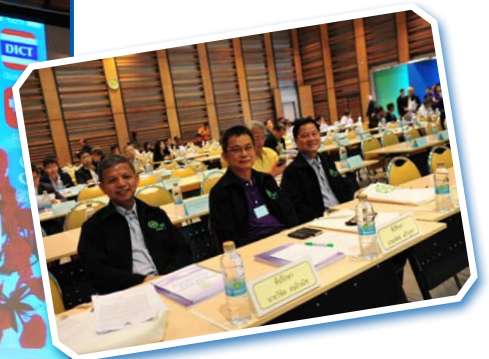
คณะกรรมการและที่ปรึกษา ชอท.