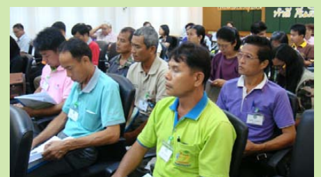
สมาชิกเข้าร่วมรับฟังการบรรยายเป็นจำนวนมาก