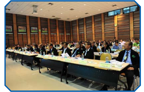
ผู้เข้าร่วมสัมมนาฟังการบรรยาย

ตั้งแต่เริ่มการก่อตั้งชุมนุมสหกรณ์ออมทรัพย์ไทยไอซีที จำกัด (ชอท.) ในปี 2555 ชอท. ก็ได้ดำเนินการพัฒนาบริการระบบงานบริหารและจัดการสหกรณ์ (ICT CCS หรือ ICT Core Co-op System) ซึ่งเป็นแอปพลิเคชัน (Application) ที่พัฒนาขึ้นสำหรับใช้บริหารการเงินเหมือนกับระบบงานหลักธนาคาร (CBS-Core Banking System) โดยในปัจจุบันได้พัฒนาโปรแกรม CCS V.1 เรียบร้อยแล้ว แต่อย่างไรก็ตามโปรแกรมนี้เหมาะสำหรับสหกรณ์ขนาดเล็กและสหกรณ์ที่มีระบบงานที่ไม่ยุ่งยาก ซับซ้อนมากนัก สหกรณ์แรกที่ได้ดำเนินการติดตั้งระบบ ดังกล่าว คือสหกรณ์ออมทรัพย์กรมพัฒนาที่ดิน จำกัด นับได้ว่าเป็นสหกรณ์แห่งแรกของประเทศไทยที่ได้ใช้งานระบบงานบริหารและจัดการสหกรณ์ที่จะเป็นยุคใหม่ของเทคโนโลยีของระบบสหกรณ์ในอนาคต โดยได้เริ่มใช้งานตั้งแต่วันที่ 31 มีนาคม 2558 ที่ผ่านมา