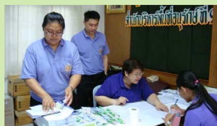
เจ้าหน้าที่ กำลังให้บริการสมาชิก