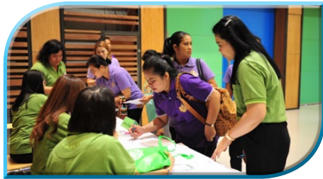
ลงทะเบียนสมาชิก