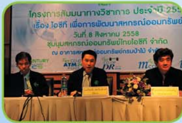
บรรยายเรื่อง สหกรณ์ ATM ของสหกรณ์ออมทรัพย์ไทย