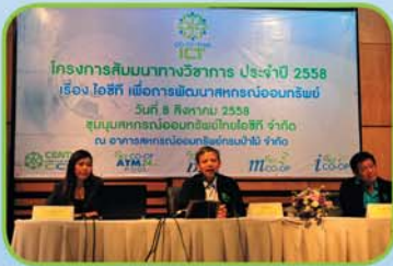
บรรยายหัวข้อ ATM สนับสนุนสมาชิก และสหกรณ์ได้จริงหรือ