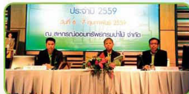
รองประธานกรรมการดำเนินการ ผู้จัดการ และเลขานุการ ดำเนินการประชุม