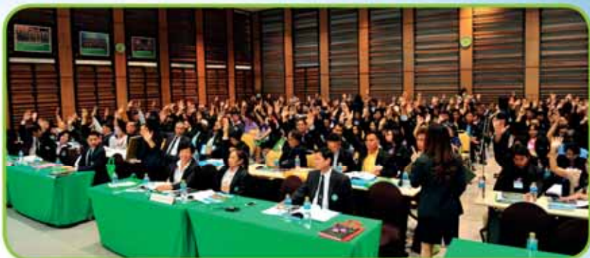
บรรยากาศการเลือกตั้งเป็นไปด้วยความคึกคัก ผู้แทนสมาชิกอนุมัติแผนงานและงบประมาณรายจ่ายประจำปี 2559