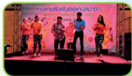
การแสดงของผู้แทนสมาชิก