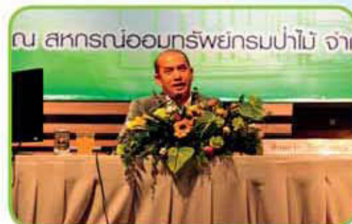
บรรยายพิเศษ เรื่อง 100 ปี สหกรณ์ไทย โดย คุณปรเมศวร์ อินทรชุมนุม รองอธิบดีอัยการ สำนักงานคดีอาญา สำนักงานอัยการสูงสุด