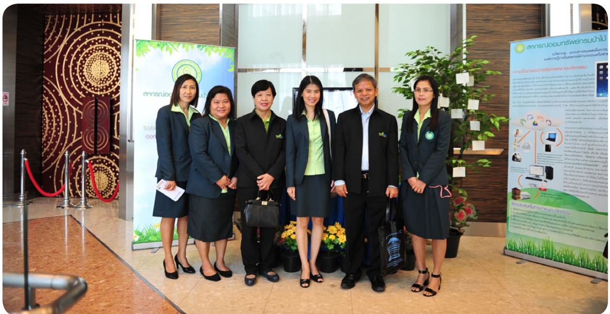
คณะกรรมการและเจ้าหน้าที่ที่เข้าร่วมงานประกวดผลงานนวัตกรรมดีเด่นระดับประเทศ

สหกรณ์ออมทรัพย์กรมป่าไม้ จำกัด ได้เข้าร่วมนำเสนอผลงานนวัตกรรมในโครงการ การคัดเลือกผลงานนวัตกรรมการบริหารจัดการสหกรณ์ออมทรัพย์ดีเด่นกรุงเทพมหานคร เขตพื้นที่ 2 ประจำปี 2558 เมื่อวันที่ 16 มกราคม 2559 ณ ชุมนุมสหกรณ์ออมทรัพย์