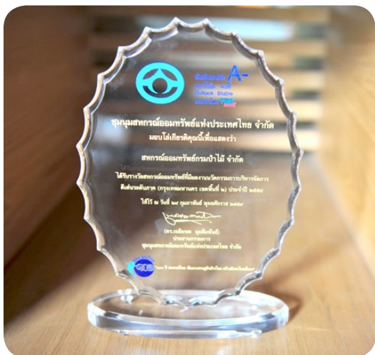
โล่เกียรติคุณ ผลงานนวัตกรรมบริการจัดการดีเด่นระดับภาค (กรุงเทพมหานคร เขตพื้นที่ 2)

ถึงแม้ว่าสหกรณ์ออมทรัพย์กรมป่าไม้ จำกัด จะไม่ได้รับคัดเลือกให้เป็นผลงานนวัตกรรมดีเด่นระดับประเทศ ประจำปี 2558 แต่การเข้าร่วมกิจกรรมในครั้งนี้ก็ถือว่าสหกรณ์ได้มีส่วนร่วมในการกระตุ้นให้เกิดการคิดค้นนวัตกรรมใหม่ๆ ในขบวนการสหกรณ์ ได้มีโอกาสแลกเปลี่ยนเรียนรู้ประสบการณ์ที่เป็นประโยชน์ในการพัฒนาการบริหารจัดการสหกรณ์ต่อไป