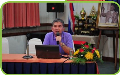
สรุปผลการปฏิบัติงานประจำปี 2558 ในแต่ละฝ่าย