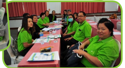
การแบ่งกลุ่มพิจารณาแผนของฝ่ายจัดการ และแผนกลยุทธ์ปี 2559