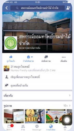
หน้าของเพจ สอ.ปม.

3. เมื่อท่านกดไลค์เพจแล้ว ให้ท่านแคปหน้าจอโพสนี้ พร้อมส่งเลขที่สมาชิกชื่อ - นามสกุล มาที่กล่องข้อความ (เฉพาะสมาชิกที่ทำตามกติกา 1 ท่านต่อ 1 สิทธิ์เท่านั้น ถึงจะมีสิทธิ์ลุ้นรับกระเป๋าเดินทางค่ะ)