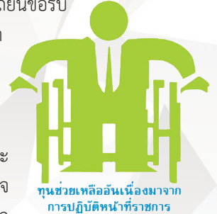
ทุนช่วยเหลืออันเนื่องมาจากการปฏิบัติหน้าที่ราชการ

ทุนสวัสดิการเพื่อช่วยเหลือสมาชิกเนื่องมาจากปฏิบัติหน้าที่ราชการ ภายในกำหนด 90 วัน นับแต่วันถึงแก่กรรม หรือได้รับอันตรายจนถึงทูพพลภาพหรือได้รับบาดเจ็บ จนไม่สามารถประกอบอาชีพใด ๆ และต้องใช้เวลารักษาหรือจนประกอบกรณียกิจตามปกติไม่ได้ ไม่น้อยกว่า 20 วัน สามารถ