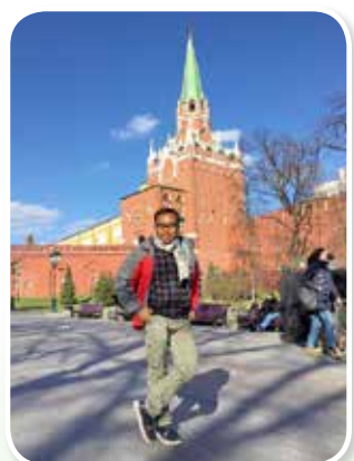
พระราชวังเครมลิน