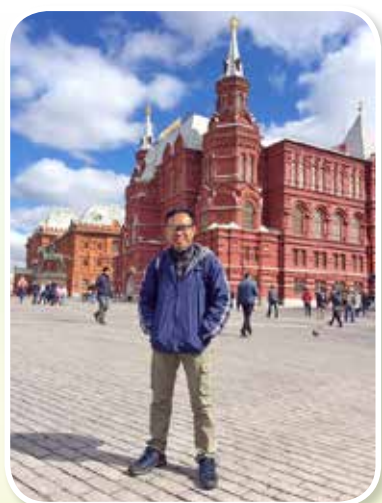
จัตุรัสแดงกรุงมอสโก