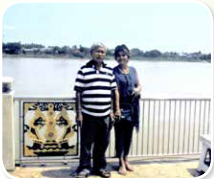
ริมฝั่งโขงท่าเสด็จ อ.เมือง จ.หนองคาย