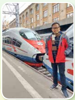
นั่งรถไฟความเร็วสูงจากมอสโกไปเซ็นต์ปีเตอร์เบิร์ก