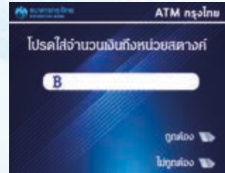
6. ระบุจำนวนเงินที่ต้องการโอน