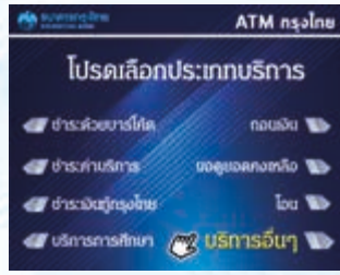
2. เลือก “บริการอื่นๆ”