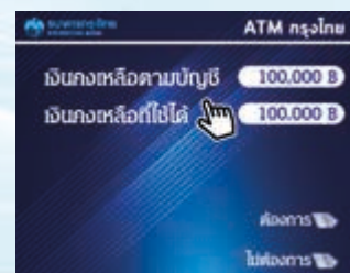
6. ดูเงินเหลือในบัญชีสหกรณ์ได้