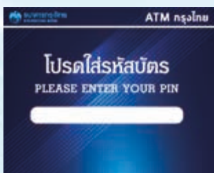
1. สอดบัตรและใส่รหัสผ่าน