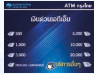
3. เลือก “บริการอื่นๆ”