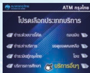
2. เลือก "บริการอื่นๆ"