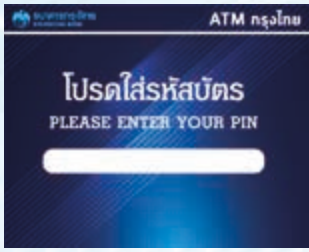
1. สอดบัตรและใส่รหัสผ่าน