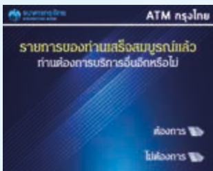
7. การโอนสำเร็จ