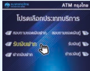
5. กด “รับเงินฝาก”