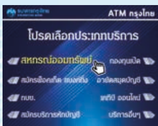
4. เลือก "สหกรณ์ออมทรัพย์"