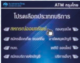
4. เลือก “สหกรณ์ออมทรัพย์”