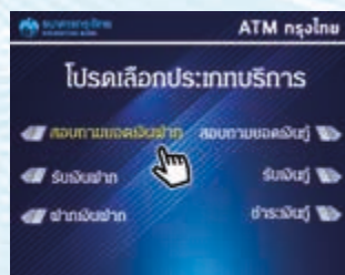
5. กด "สอบถามยอดเงินฝาก"