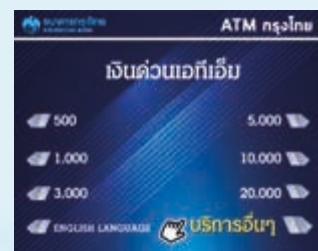
3. เลือก "บริการอื่นๆ"