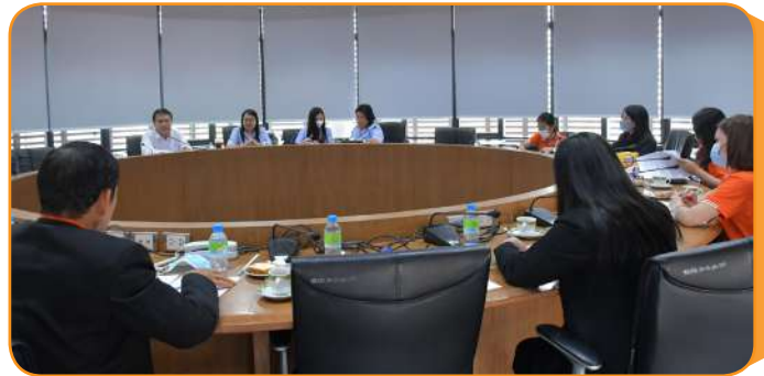
การบรรยายให้ความรู้ในเรื่องเงินกู้พิเศษเพื่อการเคหะและเงินกู้เพื่อการศึกษา