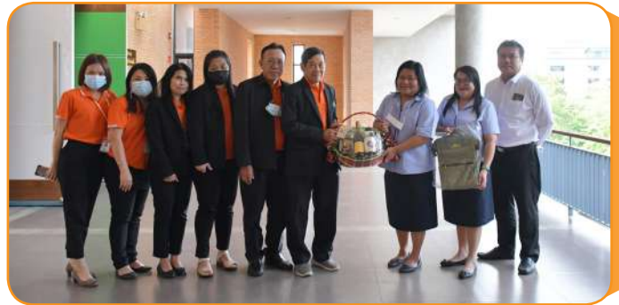
การมอบของที่ระลึก และถ่ายภาพร่วมกัน