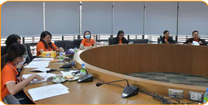
คณะศึกษาดูงาน จากสหกรณ์ออมทรัพย์กรมส่งเสริมการเกษตร จำกัด