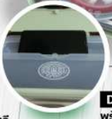
Design กั้นสมัย พร้อมที่วางมือถึง กั้นยุคออนไลน์