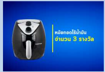
หม้อกอดร้อนน้ำมัน จำนวน 3 รางวัล