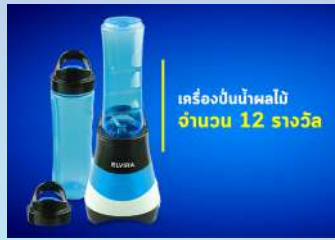
เครื่องปั่นน้ำผลไม้ จำนวน 12 รางวัล