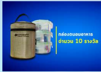
กล่องกนอมอาหาร จำนวน 10 รางวัล