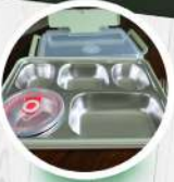
ตาถนขนาดใหญ่ นลิตจากสแตนเลสอย่างดี