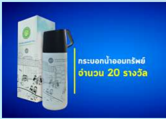
กระบอกน้ำออมกทรัพย์ จำนวน 20 รางวัล