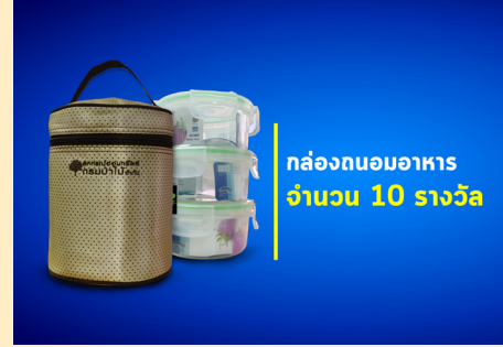
กล่องถนอมอาหาร จำนวน 10 รางวัล