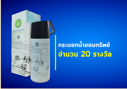
กระบอกน้ำออมทรัพย์ จำนวน 20 รางวัล