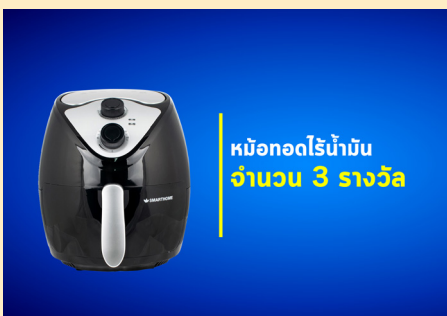
หม้อทอดไร้น้ำมัน จำนวน 3 รางวัล