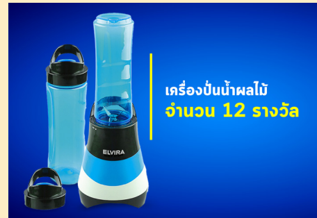
เครื่องปั่นน้ำผลไม้ จำนวน 12 รางวัล