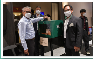
ผู้แทนสมาชิกลงคะแนนเสียงเลือกตั้ง คณะกรรมการดำเนินการ ชุดที่ 45