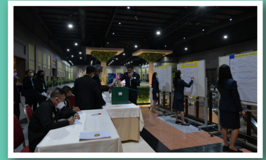
การนับคะแนนเสียงเลือกตั้ง คณะกรรมการดำเนินการ ชุดที่ 45

เสร็จสิ้นไปแล้วนะครับ สำหรับการประชุมใหญ่สามัญ ประจำปี 2565 เมื่อวันที่ 5 กุมภาพันธ์ 2565 ที่ผ่านมา ซึ่งภายในงาน ผู้แทนสมาชิกได้มีการเลือกตั้งกรรมการดำเนินการแทนกรรมการชุดเดิมที่หมดวาระทั้งสิ้น 7 ตำแหน่ง และทำการเลือกตั้งผู้ตรวจสอบกิจการ ประจำปี 2565