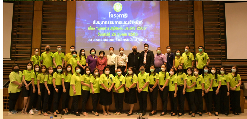
เริ่มการสัมมนา คณะกรรมการและเจ้าหน้าที่ ร่วมกัน เสนอแนะแนวทางการบริหารงานสหกรณ์ประจำปี 2565