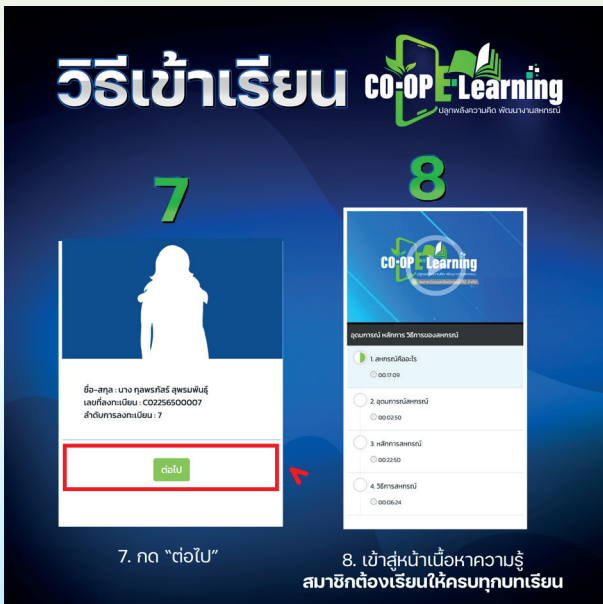
7. กด "ต่อไป"

6. จะมาสู่หน้าต่างรายละเอียด เนื้อหาของหลักสูตร และ สถานะของผู้เรียน กด "ลงทะเบียน" เพื่อเข้าห้องเรียน