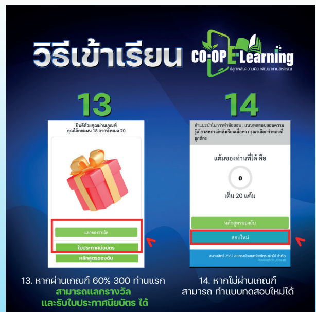
13. หากผ่านเกณฑ์ 60% 300 ท่านแรก สามารถแลกรางวัล และใบประกาศนียบัตร ได้

12. เมื่อทำข้อสอบครบแล้ว ให้กด "ส่งกระดาษคำตอบ"