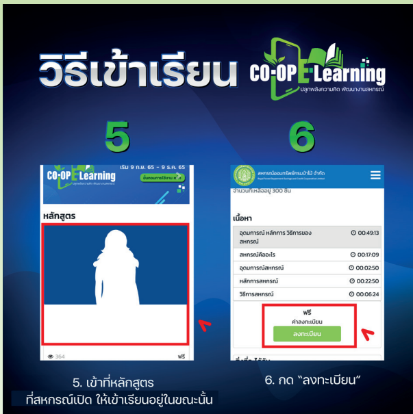
5. เข้าที่หลักสูตร ที่สภกรณ์เปิด ให้เข้าเรียนอยู่ในขณะนั้น