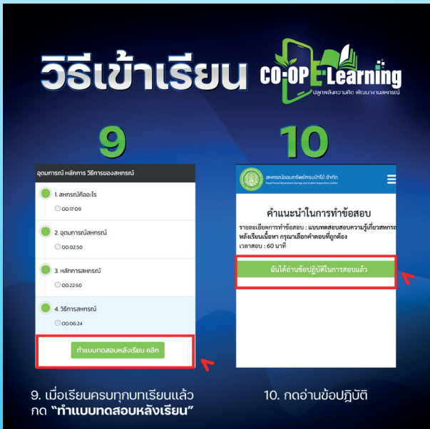
9. เมื่อเรียนครบทุกบทเรียนแล้ว กด "ทำแบบทดสอบหลังเรียน"

8. ระบบจะเข้าสู่ห้องเรียน โดยมีคลิปวิดีโอให้สมาชิกได้รับชมทั้งหมด 4 บทเรียน ซึ่งสมาชิกจะต้องเรียนให้ครบเวลา และครบทุกบทเรียน