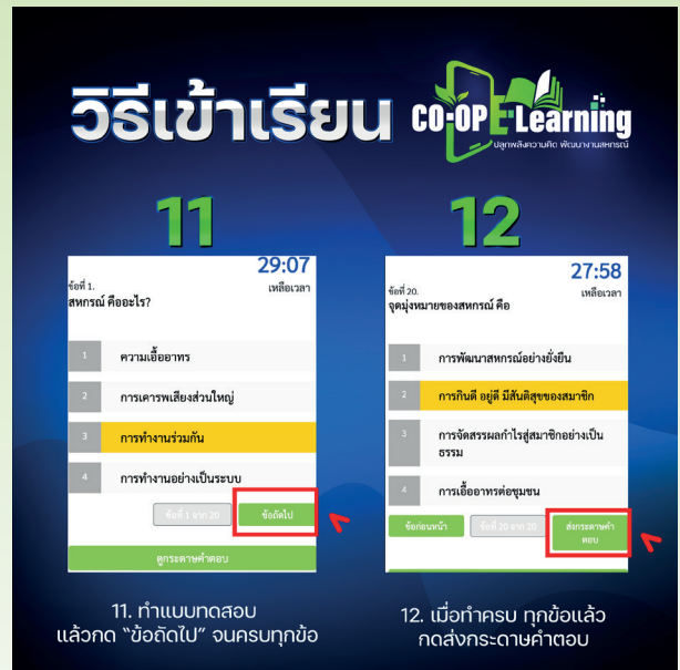
11. ทำแบบทดสอบ แล้วกด "ข้อถัดไป" จนครบทุกข้อ