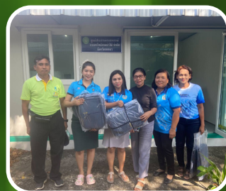
กลุ่มจังหวัดสงขลา