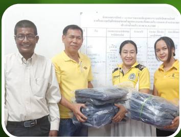
กลุ่มจังหวัดนครศรีธรรมราช