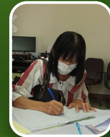
กลุ่มจังหวัดลำปาง