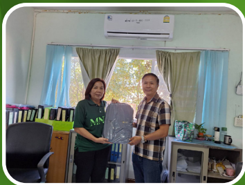
กลุ่มจังหวัดชัยภูมิ