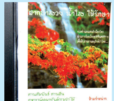
สวนสิรินธรณ์ สวนเขื่อน สหกรณ์ออมทรัพย์กรมป่าไม้ ชิมเข้มแดง