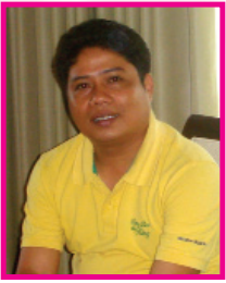
บรรจบ เขียวน้อย