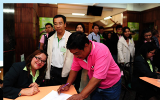
บรรยากาศการเลือกตั้ง เป็นไปด้วยความดีคัก