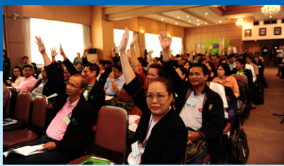
ผู้แทนสมาชิกอนุมัติแผนงานและงบประมาณรายจ่ายประจำปี 2554