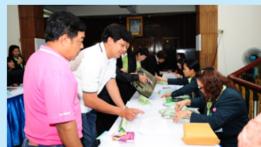
ลงทะเบียนผู้แทนสมาชิก

ประธานกรรมการดำเนินการ เลขาธิการและผู้จัดการ ดำเนินการประชุม