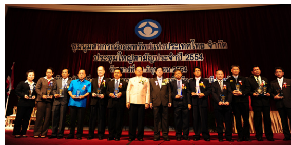
รางวัลแห่งความภาคภูมิใจ

♥ สมาชิกสมทบที่เป็นพนักงานราชการ และสมาชิกสมทบจ้างเหมาบริการ (TOR) และสมาชิกสมทบที่เป็นบุคคลในครอบครัวสมาชิกสหกรณ์เปิดให้กู้ทั้ง CO-OP Phone และเงินกู้สามัญแล้วนะจ๊ะ อ่านรายละเอียดได้ตามประกาศ จาก www.025798899.com