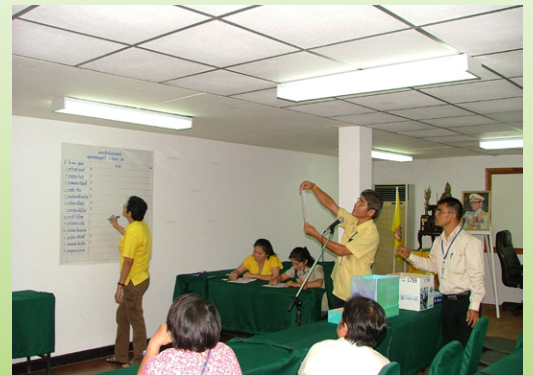
การนับคะแนนผลการเลือกตั้งผู้แทนสมาชิก