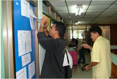
ตรวจสอบรายชื่อผู้มีสิทธิ์เลือกตั้ง

การเป็นสมาชิกสหกรณ์ นอกจากสิทธิประโยชน์มากมายที่ท่านจะได้รับในฐานะสมาชิกแล้ว สมาชิกสหกรณ์ยังหมายถึง การเป็นเจ้าของสหกรณ์ที่จะต้องร่วมมือร่วมใจกัน ช่วยเหลือซึ่งกันและกัน ร่วมกันกำหนดทิศทางของสหกรณ์ ซึ่งหน้าที่ที่สำคัญยิ่งประการหนึ่งของสมาชิกสหกรณ์คือ “การเลือกตั้งผู้แทนสมาชิก” เพื่อทำหน้าที่เป็นสื่อกลางระหว่างสมาชิกกับสหกรณ์ในการเข้าร่วมประชุมใหญ่ เพื่อพิจารณาอนุมัติงบประมาณ กงบกำไรขาดทุน การจัดสรรกำไรสุทธิ ผู้แทนสมาชิกสามารถสมัครรับเลือกตั้งเป็นคณะกรรมการดำเนินการ เพื่อเข้าไปบริหารสหกรณ์ จะเห็นว่า ผู้แทนสมาชิก คือผู้มีส่วนสำคัญยิ่งในการกำหนดอนาคตสหกรณ์ของเรา